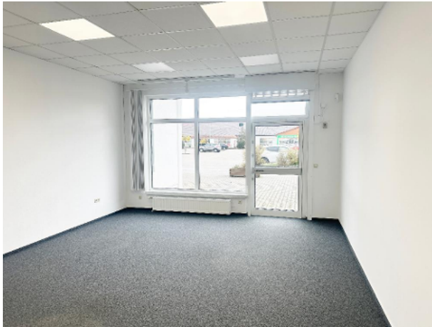
Geschäftsfläche mit Blick Richtung Eingangsbereich