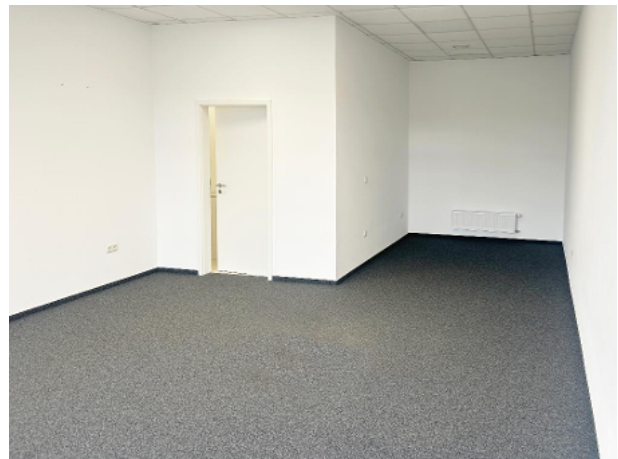
Geschäftsfläche mit Blick Richtung Küchenbereich