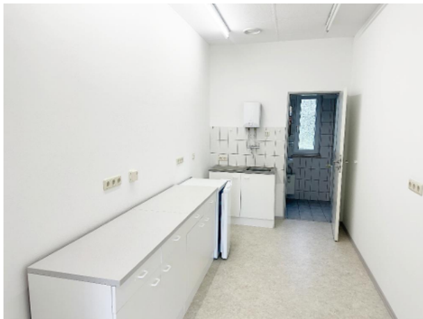
Küchenbereich mit Blick Richtung Toilette