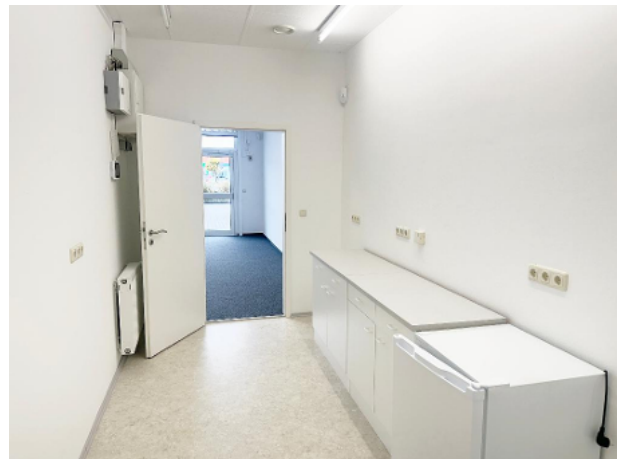
Küchenbereich mit Blick Richtung Geschäftsbereich