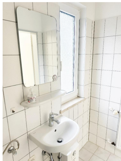
Toilette mit Waschbewcken und WC