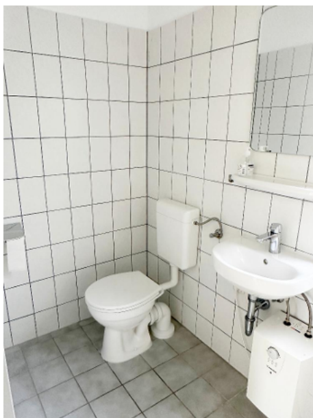
Toilette mit Waschbewcken und WC