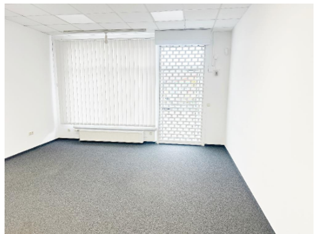
Geschäftsfläche mit Blick Richtung Eingangsbereich