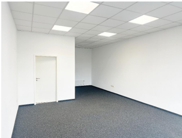
Geschäftsfläche mit Blick Richtung Küchenbereich