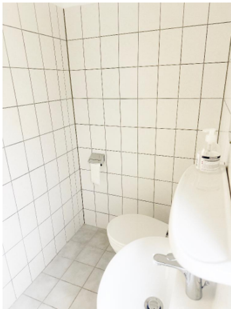
Toilette mit Waschbewecken und WC