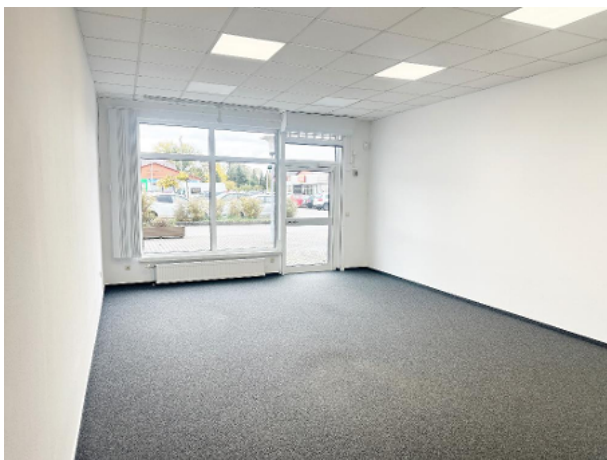
Geschäftsfläche mit Blick Richtung Eingangsbereich