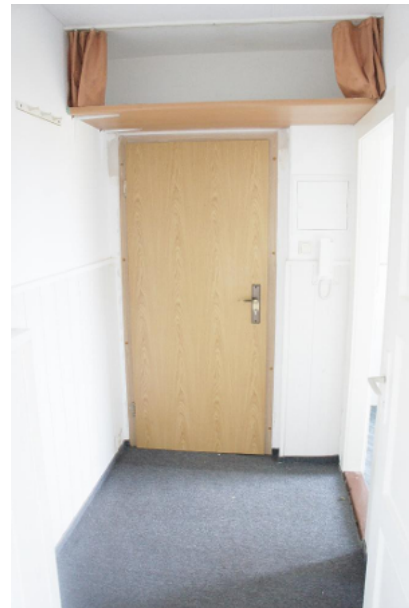
Flurbereich mit Blick Richtung Wohnungseingangstür