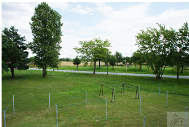
Blick aus der Wohnung