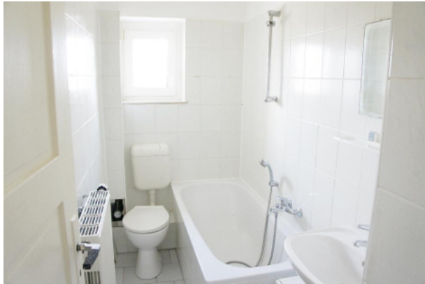
Tageslichtbad mit Wanne, WC und Waschtisch