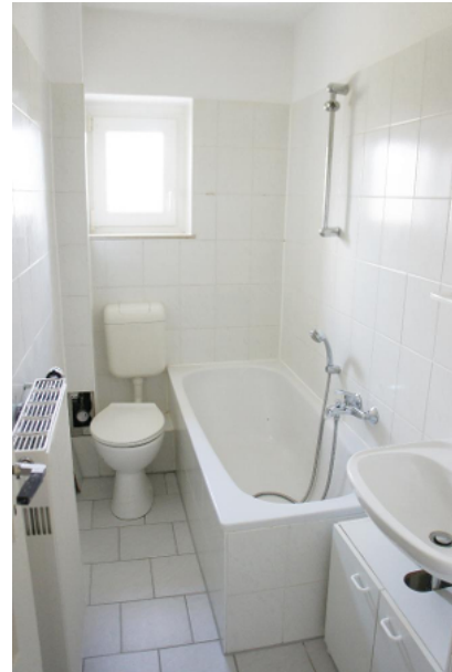
Tageslichtbad mit Wanne, WC und Waschtisch