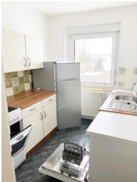
Küche mit Ober- und Unterschränken, Waschmaschine, Geschirrspüler, Ceranfeldherd und Küchenspüle