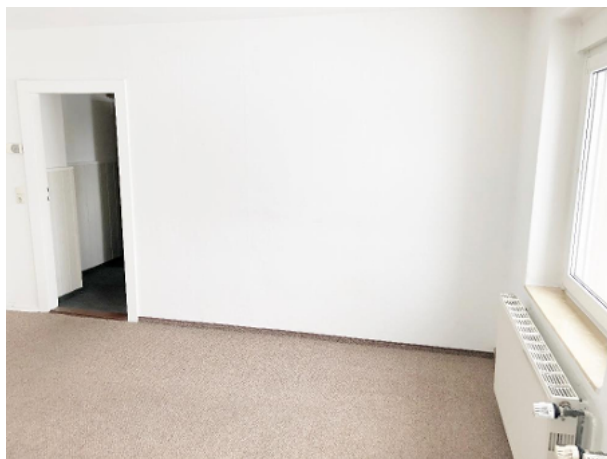
Wohnzimmer mit Blick Richtung Flurbereich